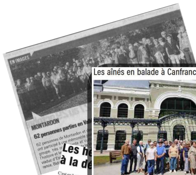
Les aînés en balade à Canfranc et