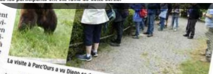
La visite à Parc'Ours a vu Diego se dresser

Vendredi 28 juin, les clubs des aînés Lou Tuc 6 l'Oursoo de Bonnut et Toustem Youens de Saint-Boès ont organisé une sortie à Canfranc. 60 participants ont pris le bus en direction de la gare d'Oloron-Sainte-Marie ; le guide de l'office du tourisme a rejoint le groupe pour un trajet en train jusqu'au terminus de Bedous. Durant ce voyage, le guide a captivé l'auditoire avec l'histoire fascinante de la ligne transpyrénéenne. Sous un soleil radieux, le groupe a découvert la gare monumentale de Canfranc. Cet édifice imposant, long de 214 mètres et désormais occupé par un hôtel 5 étoiles, est un superbe exemple d'architecture industrielle de l'époque. Le guide a partagé de nombreux détails intéressants sur cette gare emblématique, impressionnant les visiteurs par sa grandeur et son histoire. Le déjeuner a été pris au restaurant des Voyageurs à Urdos. L'après-midi, les aînés ont visité l'église, le cloître Notre-Dame-de-la-Pierre à Sarrance, et l'écomusée avec sa mise en scène originale et sa belle collection d'objets anciens et traditionnels. Tous les participants ont été ravis de cette sortie.